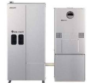
家庭用燃料電池（エネファーム）