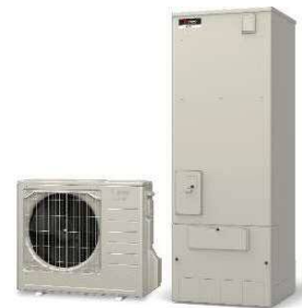
ヒートポンプ給湯機（エコキュート）

※高効率給湯器の導入と併せて蓄熱暖房機または電気温水器を撤去する場合、加算補助。