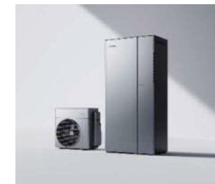
ハイブリッド給湯機